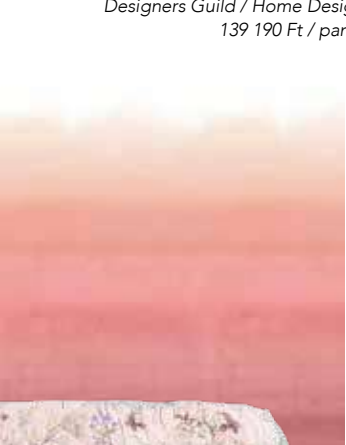
Átmenetes tapéta Designers Guild / Home Design 139 190 Ft / panel