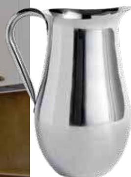
Kiöntő Hay / Mobili Mania, 12 300 Ft