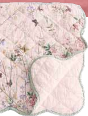
Ágytakaró H&M Home, 24 990 Ft