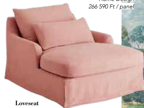
Loveseat Zara Home 299 995 Ft