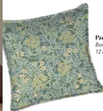
Párna Bonami 12 890 Ft

Az átmenetes, ombre festés játékos és könnyed, de már tapétát is beszerezhetünk ezzel a mintával. A hangulat megnyugtató, ha ugyanannak a színnek a különböző árnyalatai jelennek meg a falon, a bútorokon, vagy akár az ágyneműn is. A túlságosan egységes összképet természetes anyagokkal, szizál felületekkel kombinálhatjuk.