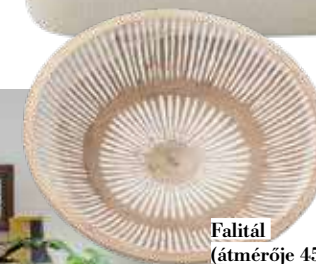
Falital (átmérője 45 cm) Kave Home / Urban Home, 56 990 Ft