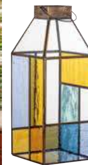
Lámpás Bloomingville / Solinfo, 34 900 Ft

A kültéri konyha esetében sem szükséges kompromisszumokat kötni: a bútorzat, a konyhagépek és a különböző kiegészítők is teljes értékűek, praktikusak és stílusosak ideális esetben. Vége azoknak az időknek, amikor a kertbe kizárólag a konyhában leselejtezett konyhai eszközök kerültek.