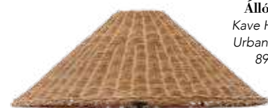
Állólámpa Kave Home / Urban Home 89 990 Ft