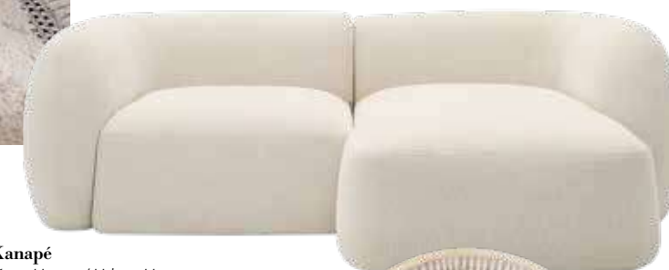
Kanapé Kave Home / Urban Home 867 990 Ft