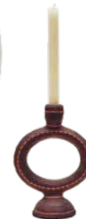
Gyertyatartó Zara Home 6595 Ft