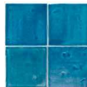
Pataki Tiles csempé (kézzel készített) 58 000 Ft/m 2