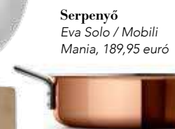
Serpenyő Eva Solo / Mobili Mania, 189,95 euró