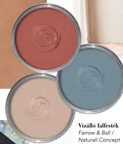
Vízálló falfesték Farrow & Ball / Naturali Concept Store, 22 900 Ft-tól