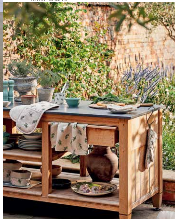
Konyharuha HAY / Mobili Mania 5930 Ft