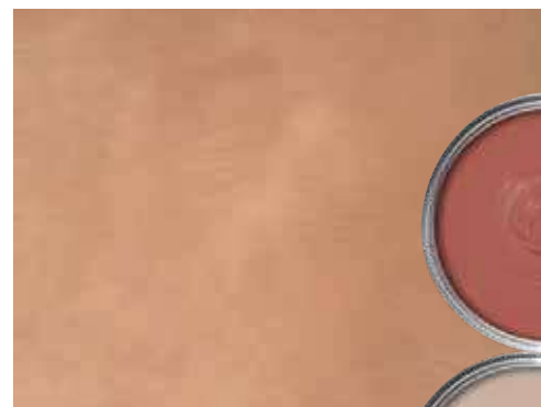
Cement Design mikrocement TENinter10r 39 900 Ft/m 2

A különböző földszínek – a homokszínű, a bézs, a terrakotta – nyugtató hatásúak és természetesebbek, a kékekkel párosítva különleges kontrasztot adnak. A réz- vagy aranyszínű csaptelepek, illetve a szabadon álló kád a kifinomult luxus érzetét nyújtják. Az íves formavilág nagyon sok részletben megjelenik manapság, ebben az enteriőrben az áttört fal nyílásán, valamint a kád formájában.