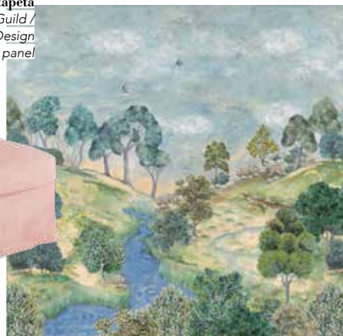
Erdei mintás tapéta Designers Guild / Home Design 266 590 Ft / panel

mintás festményt, grafikát akasztunk, esetleg az ágynemű mintája a tapétával, ágytakaróval társítva ad plusz csavart a hálószoba berendezésében. Jó irány a minták léptékeinek váltakozása, ha az egyik minta apró, a másik legyen nagyobb. Egyszerűsíti a végeredményt, ha a különböző motívumokat a színárnyalatok fogják össze: a hálószobába továbbra is passzolnak a pasztellszínek.