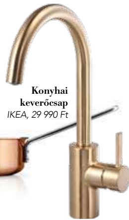
Konyhai keverőcsap IKEA, 29 990 Ft