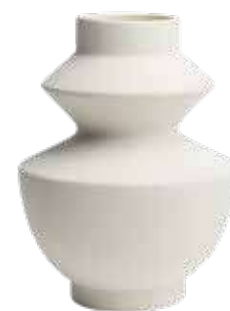
Fehér, geometrikus váza H&M Home, 9495 Ft