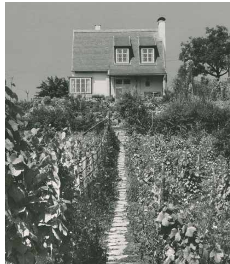
A szentendrei hétvégi ház a kert felől (1943, MÉM MDK Múzeumi Osztály)