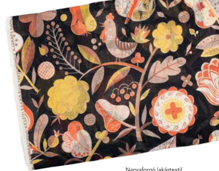
Napraforgó lakástextil. Tervezte: Lukáts Kató. Kivitelezte: P. Szabó Éva (1936, Iparművészeti Múzeum)

Ezen kívül számos úgynevezett merkantilgrafikáját ismerjük: mondhatjuk, hogy egy-egy cég komplett grafikai arculatát dolgozta ki a céges levélpapíroktól kezdve a számlócédulákon át a szórólapokig, hirdetményeket megjelenítő plakátokig.