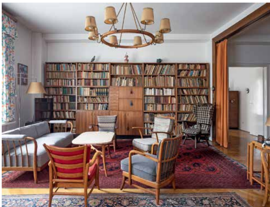
A Petöfi téri lakás nappalija Kaesz Gyula bútoraival, 2021-ben

Kaesz Gyula évtizedeken át alkotott, bútortervezői pályája kezdetén elődei és barátja, a szintén megkerülhetetlen jelentőségű Kozma Lajos építész voltak rá nagy hatással. Bútorainak stílusíve a díszesebb, klasszikusabb vonalvezetésű, akár art deco ihlettségű daraboktól indul, majd később eljut a letisztultabb, modernista formavilágig, amit tökélyre fejlesztett, és legfőbb stílusjegyévé vált.