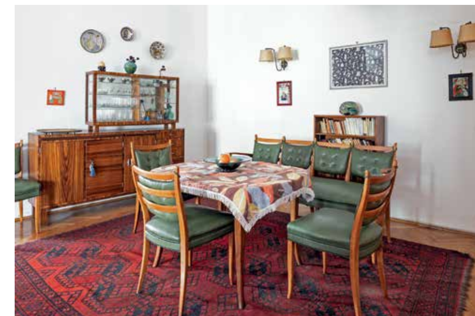
A Petöfi téri lakás ebédlője, melyen látható a megvalósult tálalószelekrény