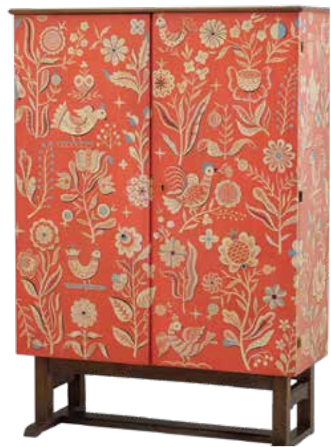
Festett kétajtós szekrény. Terv és festés: Lukáts Kató (1935, Iparművészeti Múzeum)