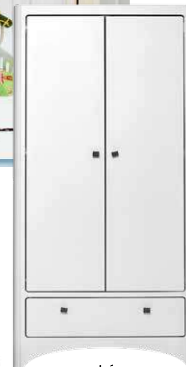
szekrény Mobili Mania 1064 euró