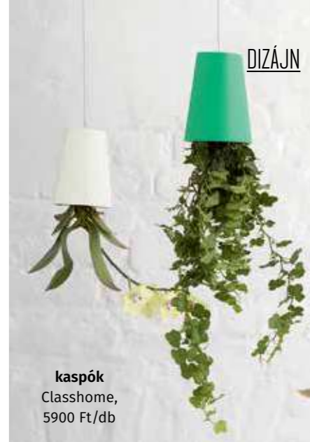
kaspók Classhome, 5900 Ft/db