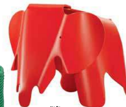
ülőke Mobili Mania, 212 euró