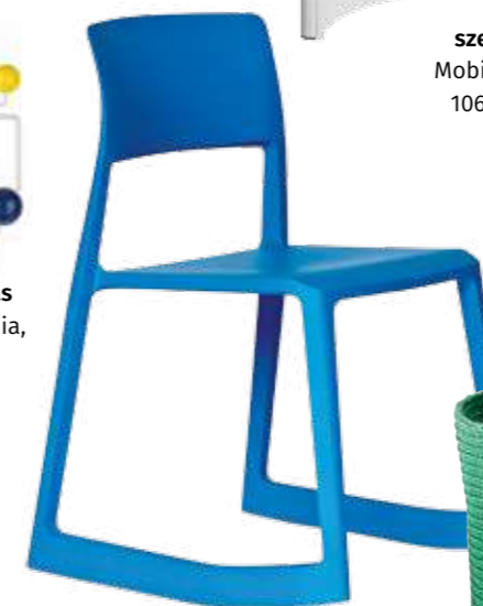
szék Kids Design, 239 euró

Az ágy legyen kényelmes, puha és hívogató, a matrac jó minőségű, az ágynemű pedig különleges. Így nemcsak aludni kellemes benne, hanem heverészni, olvasni, álmodozni.