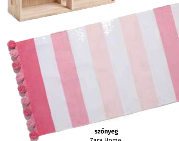
szőnyeg Zara Home, 9995 Ft