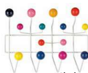
Vitra fogas Mobili Mania, 266 euró

Kizárólag abban az esetben próbálkozzunk a térmesterséges szabdalásával, területek leválasztásával, ha feltétlenül szükséges, illetve ha a szoba mérete is engedi. Nem mindig a legjobb megoldás ugyanis hatalmas térelválasztónak titulált polcokkal vagy függönyökkel elvenni a teret és a fényt: a legtöbb esetben az egyes területek más módon is kijelölhetők.