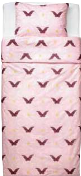
ágynemű IKEA, 3990 Ft