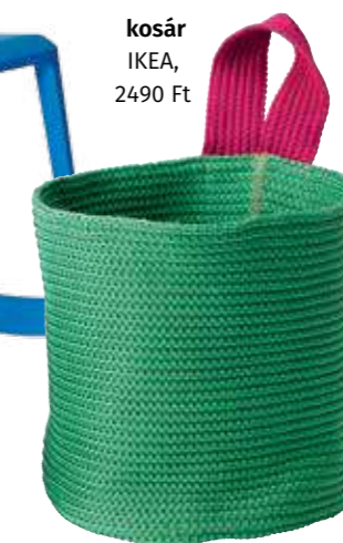
kosár IKEA, 2490 Ft

Ajándékozzuk másoknak azokat a darabokat, amikhez már nem ragaszkodnak, ezzel másoknak és magunknak is örömet szerzünk: rengeteg új pakolóhelyet nyerünk. Jó, ha minden típusú kincsnek van kosara, doboza, illetve praktikus lehet egy fiókos játéktároló, amelybe ténylegesen minden elfér. Kosárból, ládából, tálkából sosem elég.