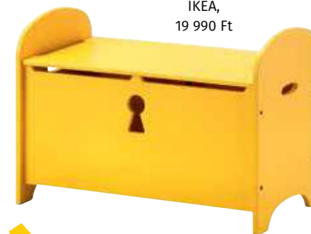
pad/tároló IKEA, 19 990 Ft