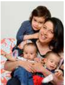
SZEGŐ ESZTER ÖSSZEÁLLÍTÁSA