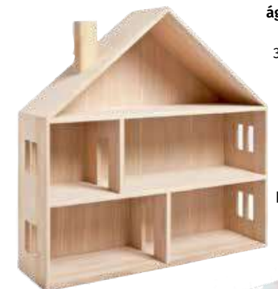
polc/babaház Zara Home, 14 995 Ft

Az autó alakú vagy herceg-nős grafikával díszített ágylátáradásul hamar megunja a gyerek, ezért befektetésnek is jobb egy fa- vagy fehér ágylátáradás, amelyet ágylátáradóval variálhatunk a koruknak megfelelően. Kiemelten fontos még a világítás, lehetőleg több helyi világítás is legyen, úgy, mint egy nappaliban: hangulatfények, olvasólámpa és általános világítás.